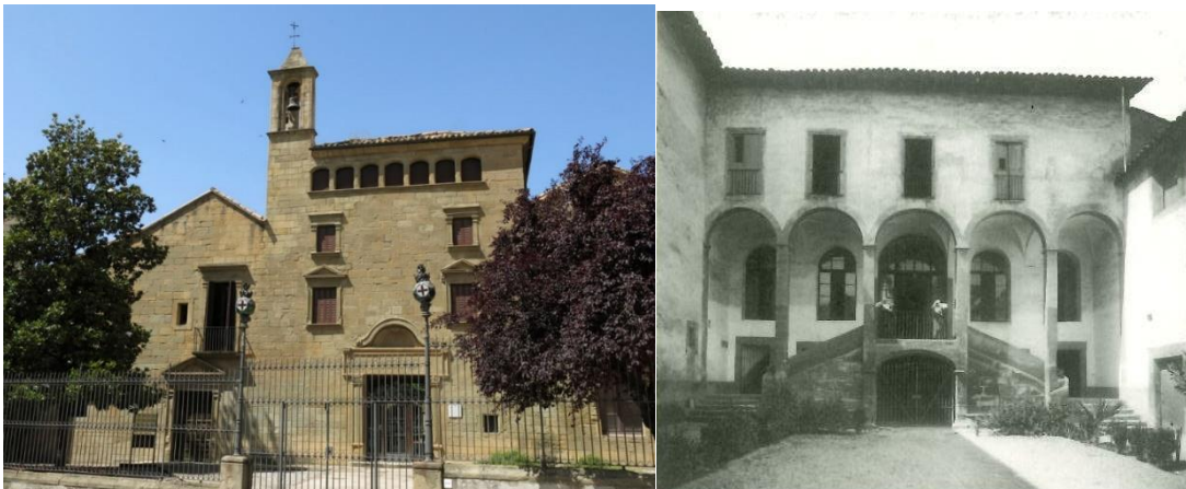
Façana i pati de l'Hospital de la Santa Creu de Vic

Aquests tres espais, la seu de Vic, la seu del Col·legi Oficial de Metges de Barcelona i el futur espai a l'Hospital de la Santa Creu de Vic, han de concebre's de manera integrada, formant un únic conjunt. A aquests efectes, l'adjudicatari ha d'oferir una proposta de tipus tecnològic/interactiva que permeti la interrelació entre les tres ubicacions, amb la finalitat que els visitants puguin gaudir de les diferents exposicions independentment de l'espai físic en que es trobin.